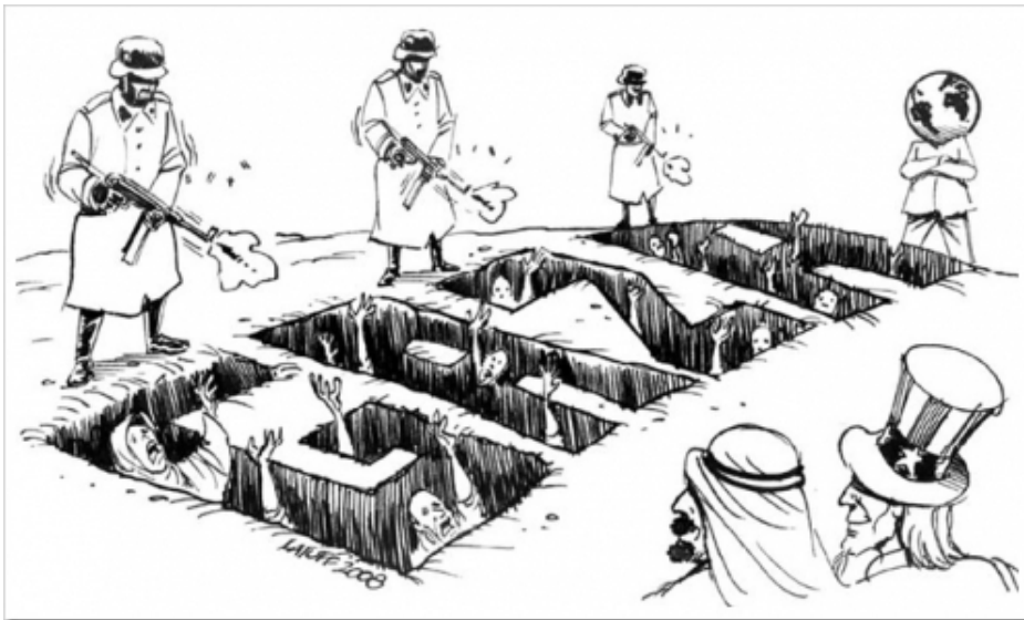
Israeli raid on Gaza by LATUFF 2008

Enough is enough. Now Gaza, on top of everything else. The Palestinians symbolise the ongoing struggle worldwide against USrael's neo-colonial wars. Zionist goals cannot be met without genocide. To uphold a Jewish state it is necessary to commit crimes that are defined as genocide in The UN Convention on the Prevention and Punishment of the Crime of Genocide signed by the General Assembly on December 9 th , 1948. It states: