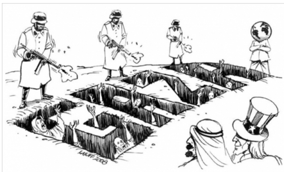
Israeli raid on Gaza by LATUFF 2008

Det är nog nu. Gaza är droppen. Palestinierna är symbolen för den kamp som världens folk för mot USraels nykoloniala krig . Sionismens mål kan inte genomföras utan folkmord. Den judiska staten förutsätter en rad brott som finns definierade i FN:s konvention mot folkmord, antagen av Generalförsamlingen den 9 december 1948. Där sägs följande: