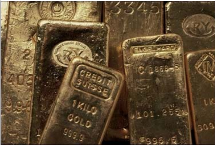
Desperate for funding, the Kim Jong-il regime has begun selling off its gold reserves.

so good that even specialists are unable to distinguish them from genuine notes, have circulated for almost two decades without a reliable identification of the culprits. Because of their extraordinary quality, experts assume that some country must be behind the enterprise.