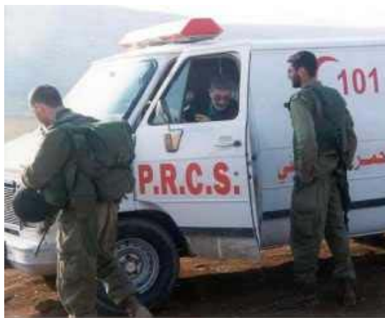
Soldiers searching a Palestinian Ambulance