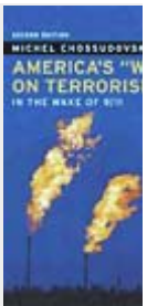
America's "W" Terrorism", by Michel Chossudovsky

The underneath postings are under the only responsibility of the authors, and not necessarily we agree with them. If someone feels that any comment contains pornographic or racist expressions, or contents contrary to the law, let us know and - if our legal office confirms - it will removed asap.