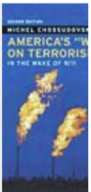
America's "W" Terrorism", by Michel Chossudovsky

The underneath postings are under the only responsibility of the authors, and not necessarily we agree with them. If someone feels that any comment contains pornographic or racist expressions, or contents contrary to the law, let us know and - if our legal office confirms - it will removed asap.