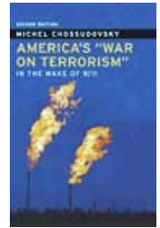
America's "War on Terrorism", book by Michel Chossudovsky

Abir was killed as part of U$ "initiate civil war" operation. The US army wants to slaughter people of Iraq while blaming it on the resistance. They